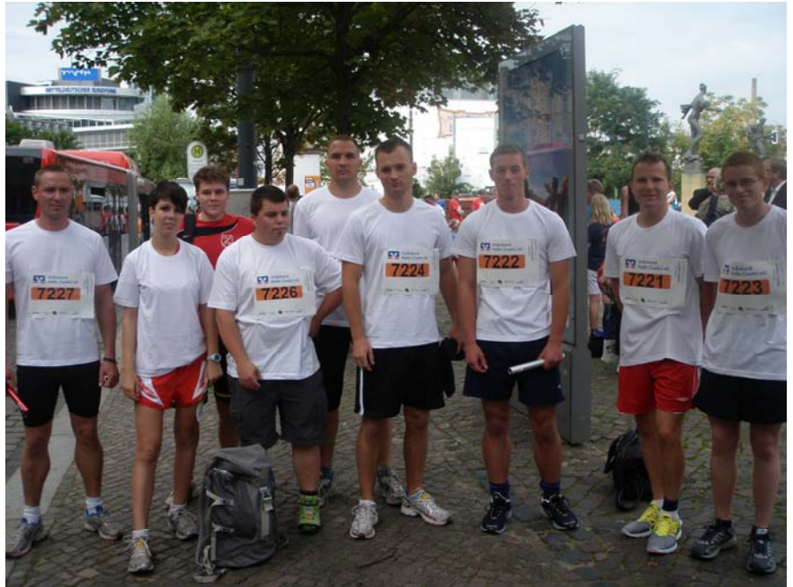
Unsere Azubis kurz vor dem Start – gleich geht's los ...