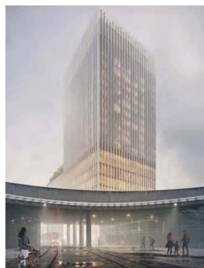
Die Fassadengestaltung geht auf einen Entwurf der KSP Jürgen Engel Architekten aus Berlin zurück. Visualisierung: KSP

Das neue Hochhaus wird mit seinem markanten Auftritt seiner städtebaulichen Verantwortung als Mittler zwischen Hauptbahnhof und Innenstadt gerecht: Zehn