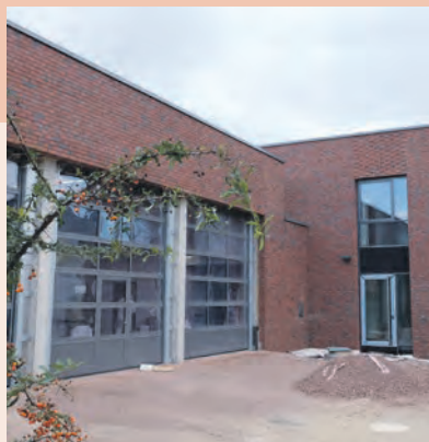
Fertigstellung: April 2020 Kosten: 2,5 Millionen Euro (100 % städtische Eigenmittel)

Die Freiwillige Feuerwehr Dölau erhält ein neues Gebäude, das in allen Belangen den aktuellen sicherheitstechnischen Standards entspricht. Nach dem Abriss des alten Gebäudes im Juli 2018 folgte bereits im November 2018 die Grundsteinlegung für den Ersatzneubau an selber Stelle. Auf dem rund 1000 Quadratmeter großen Grundstück „Am Brunnen“ entsteht ein Gerätehaus mit drei Stellplätzen, einem Schulungs- und Sozialtrakt, mit Räumen für die Mitglieder der Kinder- und Jugendfeuerwehr sowie einem Lager.