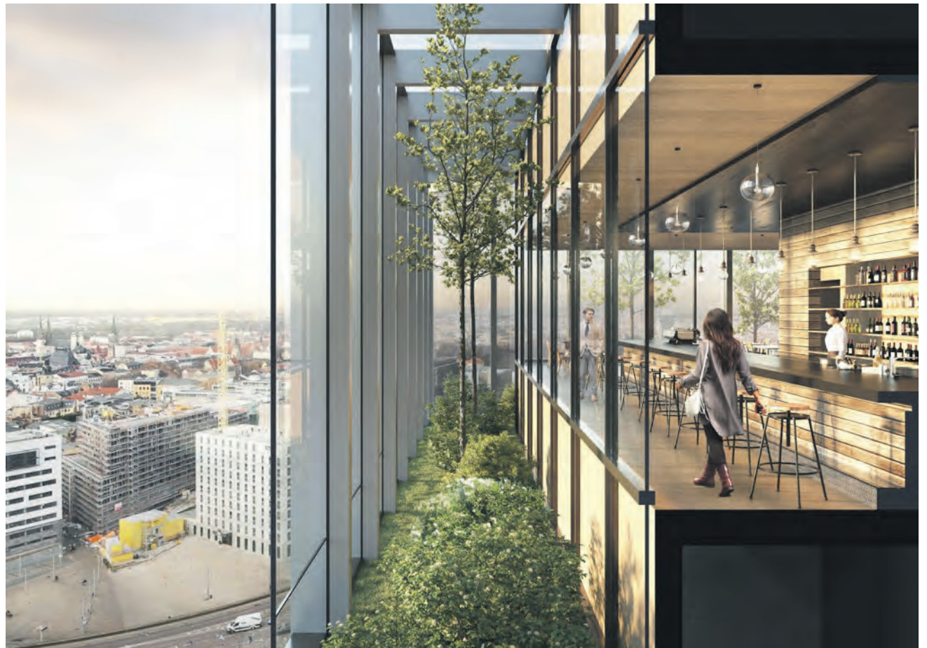
Das neue Hotel am Riebeckplatz soll in einer der obersten Etagen ein Restaurant beherbergen. Die Dachbegrünung wird nach einem Entwurf der HPP Architekten GmbH aus Leipzig gestaltet. Visualisierung: bloomimages

Die Stadt Halle (Saale) und die Hallesche Wasser und Stadtwirtschaft GmbH rufen alle Einwohnerinnen und Einwohner vom 27. März bis 5. April 2020 zum Frühjahrsputz auf öffentlichen Flächen im Stadtgebiet auf. Auch Vereine, Initiativen, Unternehmen oder Hausgemeinschaften können sich beteiligen. Die Koordination des Frühjahrsputzes übernimmt das städtische Dienstleistungszentrum Bürgerbeteiligung. Aktionen können angemeldet werden unter Telefon 0345/221 1115 oder per E-Mail an: dlz-buergerbeteiligung@halle.de Eine Übersicht der Aktionen im Internet unter: www.fruehjahrsputz.halle.de