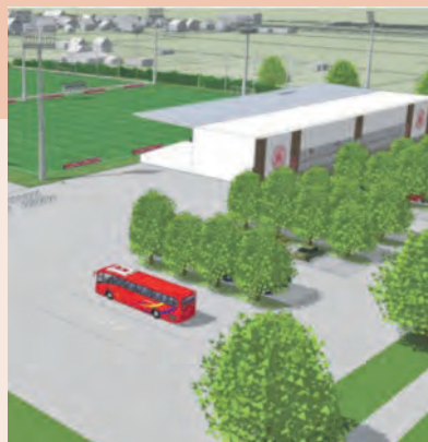
Bauzeitraum: Mai 2020 bis zum zweiten Quartal 2022 Kosten: 11,3 Millionen Euro (100 % Fluthilfemittel des Landes)

Der erste Spatenstich für das Nachwuchszentrum für den Fußball ist für Mai 2020 geplant. An der Karlsruher Allee auf der Silberhöhe soll der Ersatzneubau errichtet werden. Der alte Standort am Sandanger wird aufgegeben, da er sich unmittelbar im Hochwassergebiet befindet. Es sollen fünf Groß- und zwei Kleinfelder entstehen. In einem Gebäude werden neben den Sanitäreinrichtungen auch Verwaltungsräume, Fitnessbereiche und eine Cafeteria untergebracht. Derzeit erfolgen auf dem Areal bereits vorbereitende Maßnahmen.