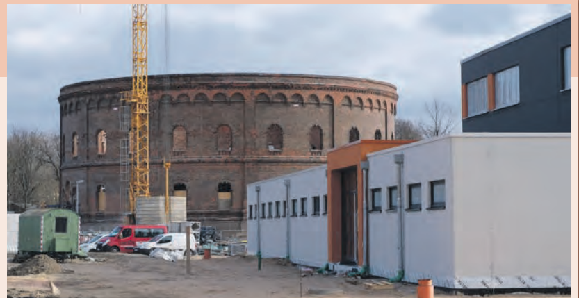
Fertigstellung Sporthalle: Mai 2020 Kosten Sporthalle: 6,6 Millionen Euro (100 % städtische Eigenmittel)

Das neue Viertel am Holzplatz entwickelt sich rasant: Im August 2019 wurde die neue Schule eröffnet – nach einer Rekordbauzeit von neuneinhalb Monaten. In diesem Jahr werden zwei weitere Etappenziele erreicht: die Freigabe der Turnhalle für den Schul- und Vereinssport sowie das Richtfest für das neue Planetarium. Die denkmalgerechte Instandsetzung der Außenhülle des ehemaligen Gasometers ist bereits abgeschlossen und die Arbeiten am Rohbau im Inneren haben begonnen. Herzstück ist der Kuppelsaal mit 110 Plätzen.