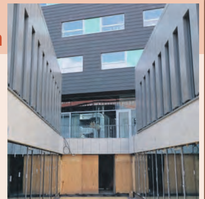
Fertigstellung: August 2020 Kosten: 18,9 Millionen Euro (100 % Fluthilfemittel des Landes)

Die Sanierung des vom Hochwasser stark geschädigten Mitteldeutschen Multimediazentrums wird in diesem Jahr abgeschlossen. In einem ersten Bauabschnitt wurde das Studio für die Kinetonmischung wiederhergestellt. Der zweite Abschnitt umfasst die Gebäudesanierung und die Errichtung einer Hochwasserschutzwand. Zudem werden auf der Plateau-Ebene zwei Kuben für rund 20 Büros und ein Tonaufnahmestudio eingerichtet. Diese Flächen ersetzen die weggefallenen Büroräume im seinerzeit überfluteten Untergeschoss.