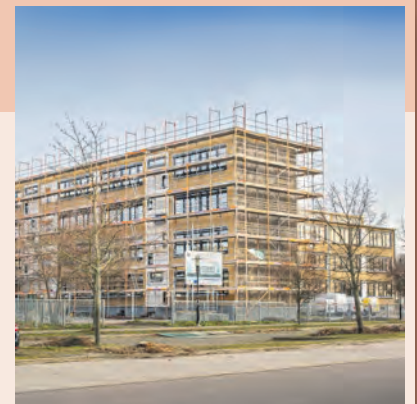
Fertigstellung: Oktober 2020 Kosten: 7,9 Millionen Euro (4,9 Millionen Euro städtische Eigenmittel, 3 Millionen Euro Fördermittel von Bund, Land und Europäischer Union)

Während die Schülerinnen und Schüler im Ausweichstandort an der Ottostraße lernen, wird die Grundschule auf der Silberhöhe saniert. Im Zuge dessen erhalten das Dach und die Fassade eine Wärmedämmung. Es werden dreifach verglaste Fenster eingebaut, ein Sonnenschutz angebracht, die Heizungen erneuert und energiesparende Beleuchtung eingesetzt. Das Gebäude bekommt einen Aufzug, einen zweiten Rettungsweg und neue Sanitarräume sowie Bodenbeläge. Zugleich wird die technische Ausstattung erneuert.